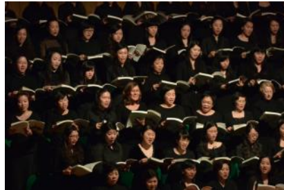
香港管弦樂團合唱團