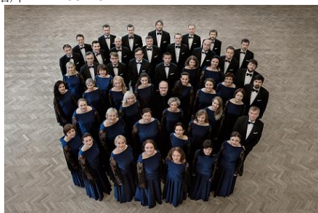
拉脫維亞國家合唱團