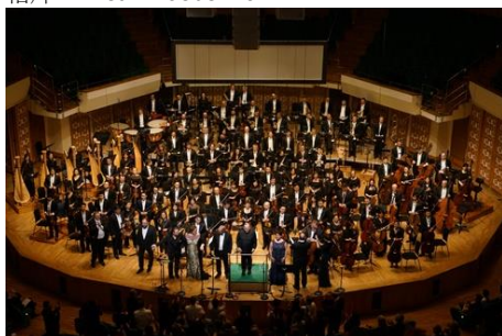
梵志登及港樂的《齊格菲》