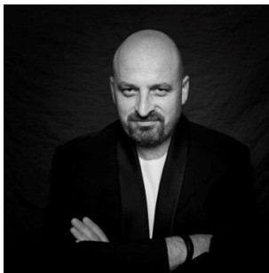
卡爾文 飾 阿爾貝里