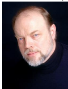
哈夫維森 飾 哈根