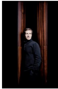
魯根斯基 Naalåve-Ambroisie