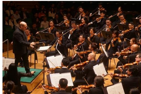
梵志登與香港管弦樂團