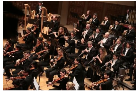
香港管弦樂團