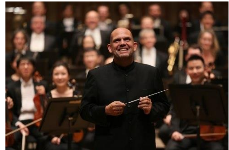
香港管弦樂團