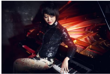
王羽佳