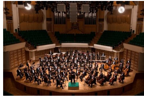
香港管弦樂團