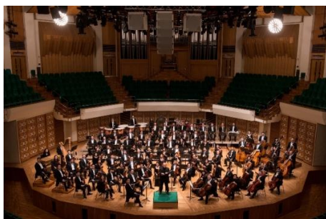
梵志登與香港管弦樂團