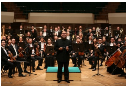
梵志登與香港管弦樂團