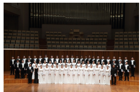
國家大劇院合唱團