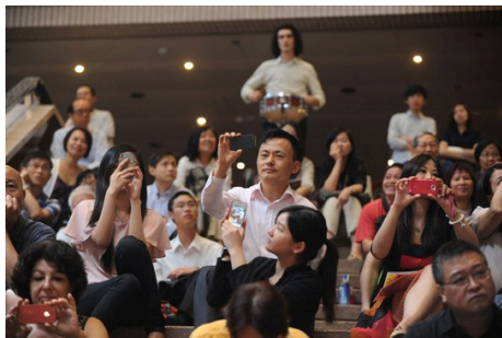
05. 70 多名港樂成員忽然現身文化中心「快閃」演奏拉威爾的《波萊羅》，吸引在場觀眾紛紛拍照