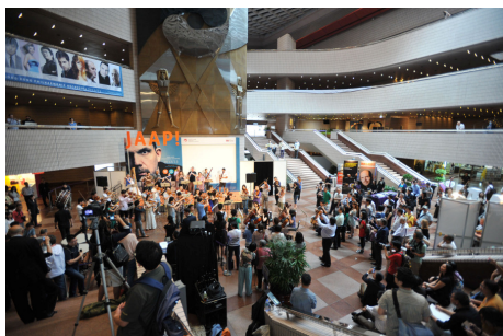
07. 超過 70 位港樂精英奏「爆」文化中心大堂