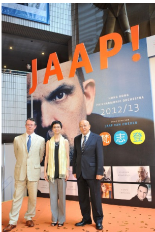
03. 眾嘉賓於揭幕儀式後合照