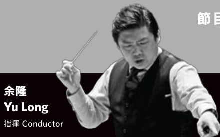
余隆 Yu Long 指揮 Conductor

法國鋼琴家蒂博代，瀟灑、前衛、有深度，他將演繹兩首截然不同的作品：《我有節奏》變奏曲，歌舒詠筆下的爵士經典，輕狂奔放、慵懶自在；《二簧》，旅法中國作曲家陳其鋼的鋼琴協奏曲，取材自京劇抒情聲腔二簧元板，時而淡然時而激昂，由蒂博代在香港首演，樂迷定必翹首盼望。下半場，首席客席指揮余隆指揮艾爾加著名的「謎語」變奏曲，與上半場玩變奏的爵士樂曲前後呼應，加上中西合璧的元素，令人回味無窮的當代音樂夜。