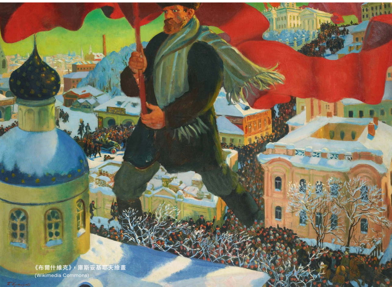
《布爾什維克》，庫斯妥基耶夫繪畫 (Wikimedia Commons)