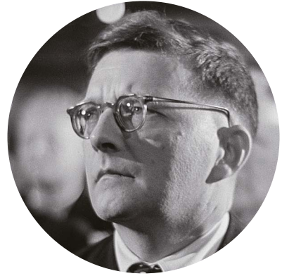
蕭斯達高維契

如果蕭斯達高維契的第八弦樂四重奏聽起來很哀傷，原因可能是作曲家當時特別消沉。他為被迫加入共產黨感到挫敗，把作品題獻給戰爭和法西斯主義的受害者。當鮑羅丁四重奏為蕭斯達高維契演奏這首作品時，作曲家激動得不知所措，掩面痛哭。